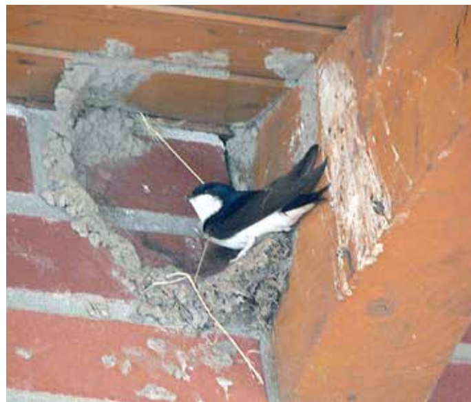
Mehlschnalbe beim Nestbau

Bei Fragen und zur Information ist die Kreis-Naturschutzbehörde unter der Tel.-Nr. 03695/61-6701 zu erreichen.