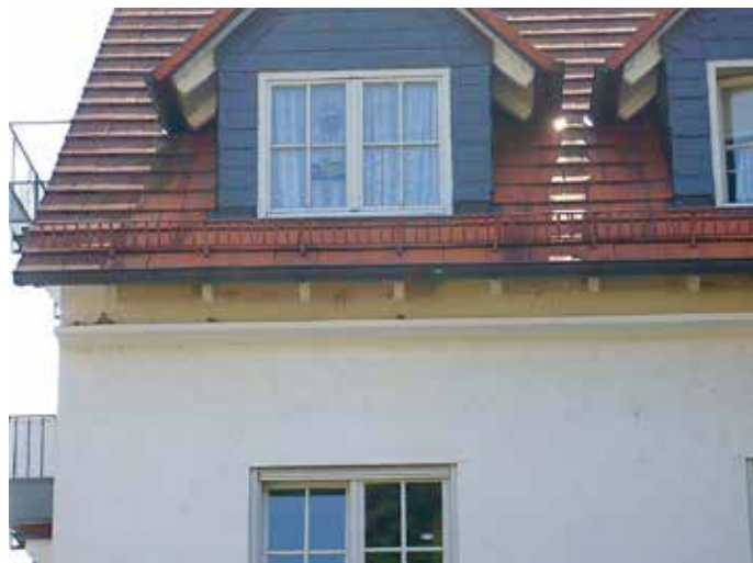
Kotbrettchen aus Leichtkunststoff