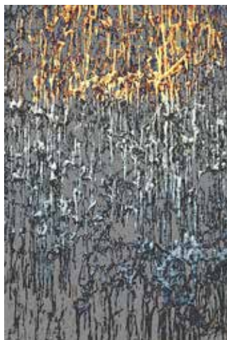
Sole trifft Sonne und Schwarzdorn