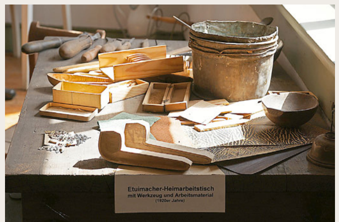
Etuimacher-Heimarbeitstisch mit Werkzeug und Arbeitsmaterial (1920er Jahre)