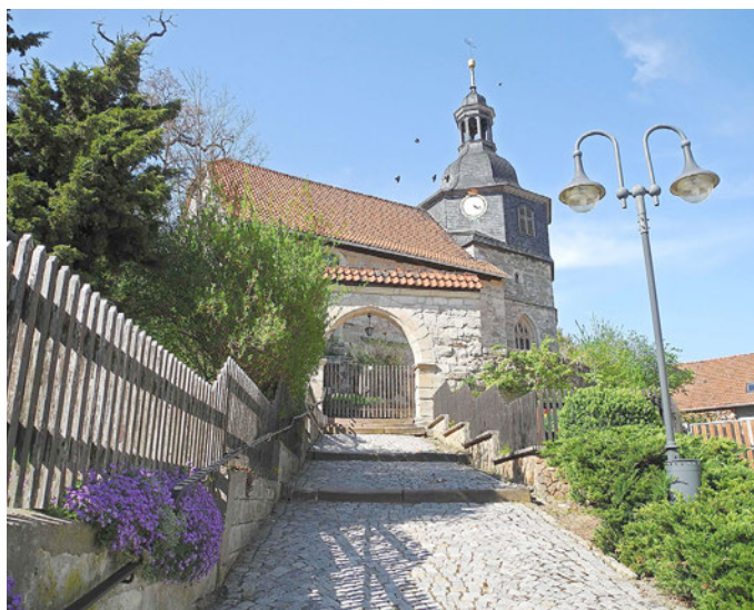
Die Lutherkirche in Möhra

MÖHRA. Der Haushaltsausschuss des Bundestags hat am Mittwoch, 19. Mai 2021 Mittel in Höhe von bis zu 80.000 EUR für Sanierungsmaßnahmen an der Lutherkirche in Moorgrund OT Möhra beschlossen. Die Fördermittel dienen der Sanierung des Kirchturms. Darüber informiert der CDU-Bundestagsabgeordnete Christian Hirte. „Die Lutherkirche in Möhra ist aufgrund ihrer Bauart eine touristische Sehenswürdigkeit unserer Region. Im Zuge des 500-jährigen Reformationsjubiläums sowie des regelmäßigen stattfindenden Lutherfestes erlangte die Kirche überregi-