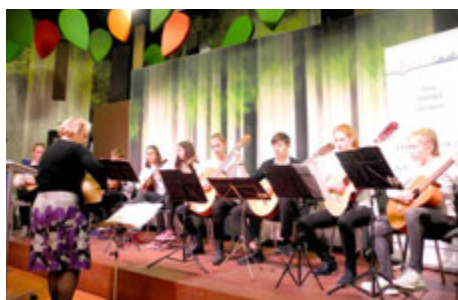
Das Zupfensemble der Musikschule Johann-Sebastian Bach Eisenach