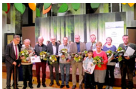
Für besondere Leistungen über viele Jahre im Amphibienschutz gab es eine Auszeichnung