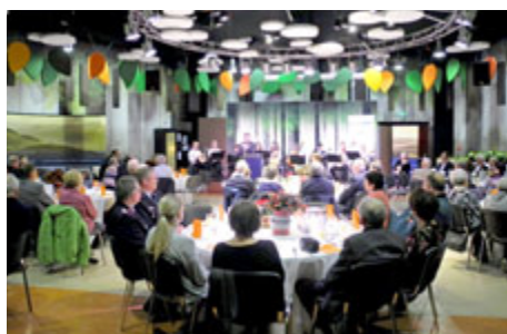
Blick in den Nakundu-Saal des Urwald-Life-Camps auf dem Harsberg