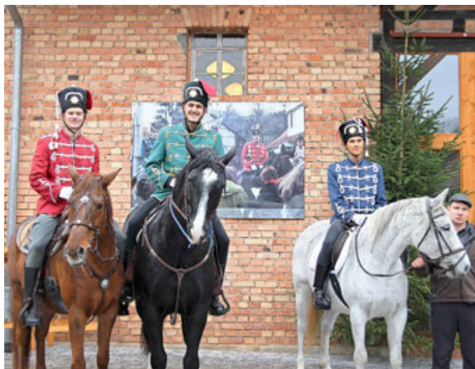
Die Husaren des Jahres 2019