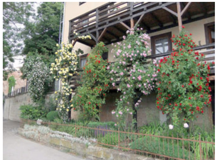
Die Kletterrosen im Vorgarten der Familien Wuttig und Spieß am Bad Salzunger Burgsee begeistern vorbei kommende Spaziergänger aus nah und fern