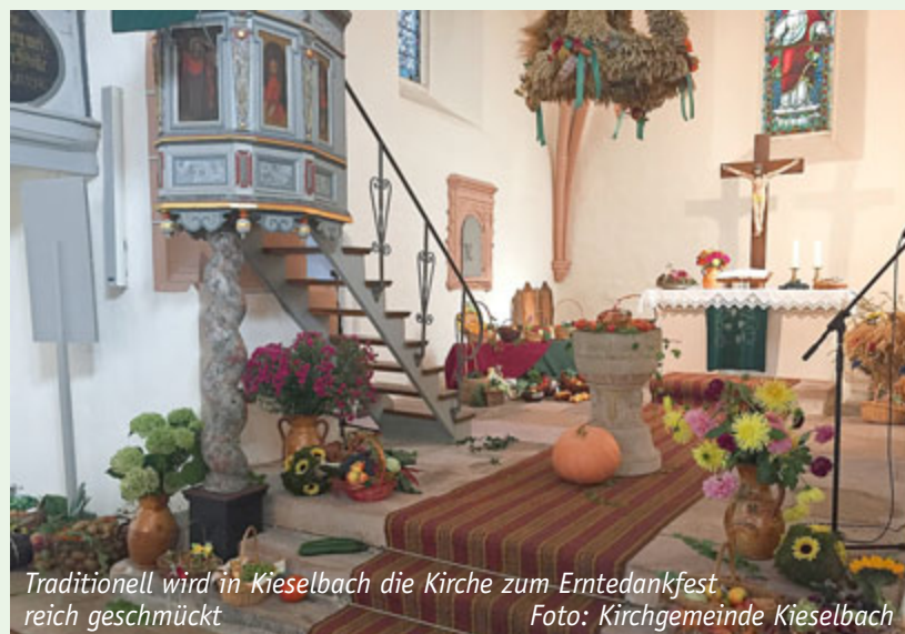
Traditionell wird in Kieselbach die Kirche zum Erntedankfest reich geschmückt