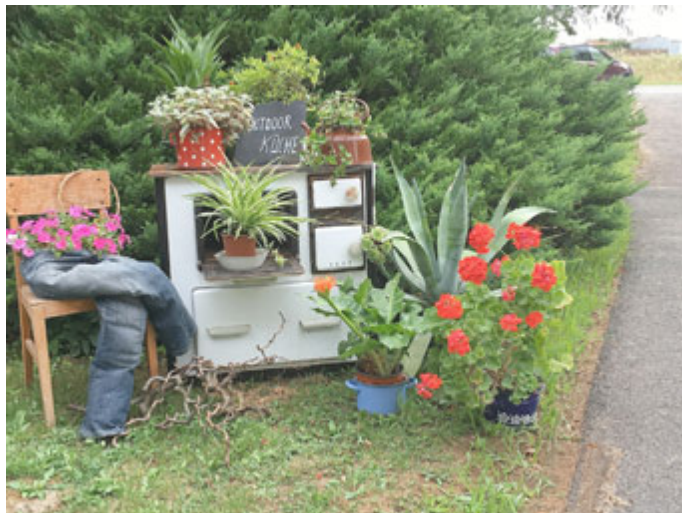
Sieglinde Ortlepp aus Hörselberg-Hainich beteiligt sich mit ihrer „Outdoorküche“ am Wettbewerb