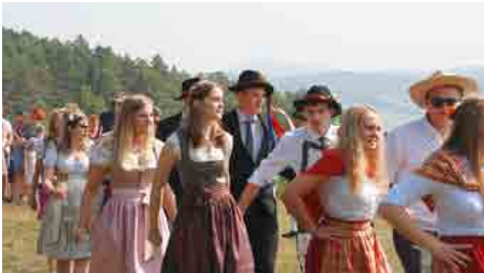
Nach dem Gottesdienst am Sonntag zogen Besucher und Mitwirkende zum Kirmesbaum