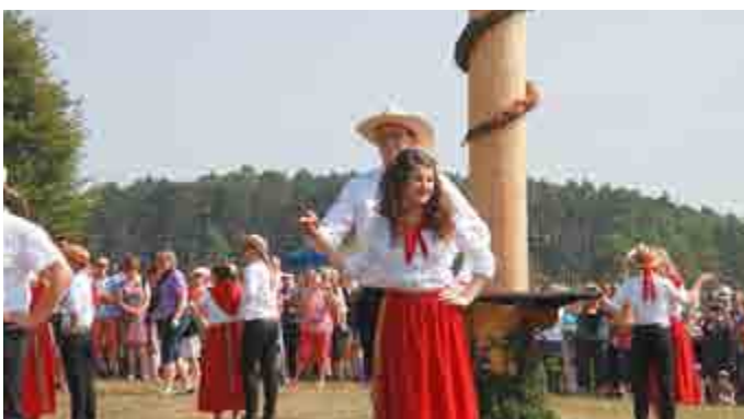
Tanz um den Kirmesbaum