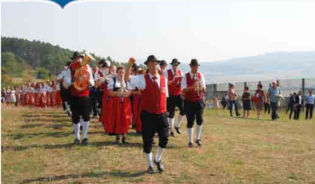
Entlang des Grenzzauns ziehen die Kirmesgesellschaften, die Kapelle und die zahlreichen Besucher zum Kirmesbaum

9. September 2019 · 12/2019 · Jahrgang 12