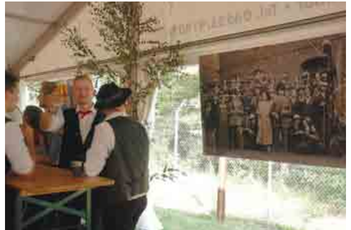
Die Siegerbilder des Fotowettbewerbs waren im Festzelt ausgestellt