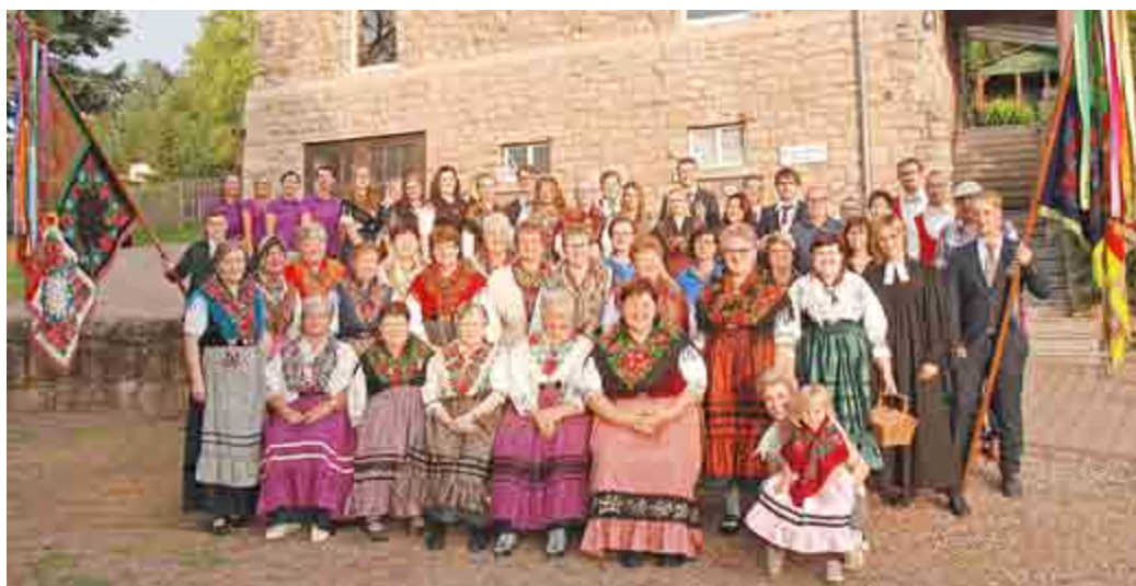
Rege Beteiligung in Kieselbach am Erntedankfest

außerdem zum Basteln, Luftballonspaß, Kinderschminken und Glitzertattoos eingeladen sind. Außerdem steht eine Hüpfburg bereit. Der Heimatverein präsentiert eine Ausstellung im Pfarrhaus. Vereine versorgen die Gäste den ganzen Tag mit Mittagessen, Kaffee und Landfrauenkuchen.