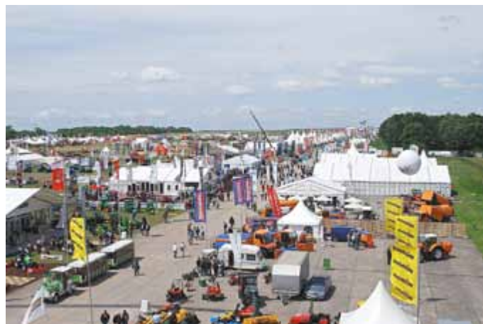
Das Flugplatzgelände zur Demopark

Zunehmend wird der Flugplatz von Piloten anderer europäischer Flugplätze zur Erkundung der Sehenswürdigkeiten der Welterberegion Wartburg-