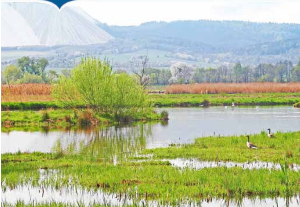
Blick aus den Dankmarshäuser Rhäden zum „Monte Kali“