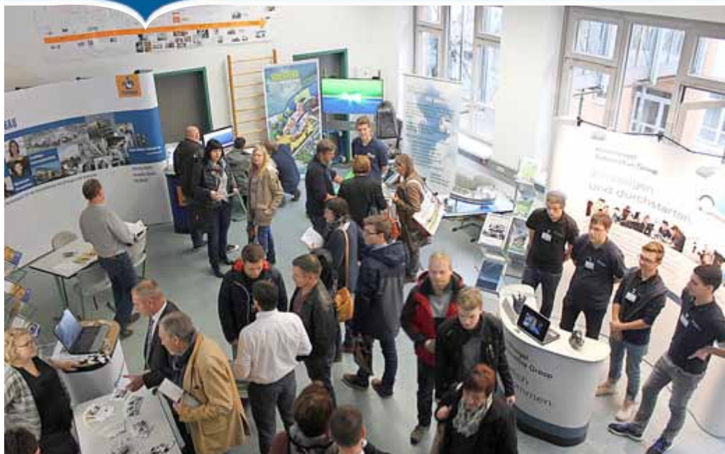
Zum Berufemarkt 2016 in der Berufsschule Bad Salzungen