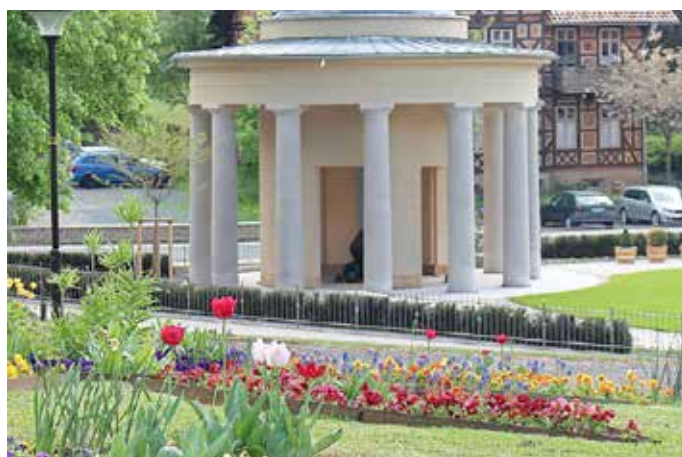
Bad Liebenstein, Kurpark Brunnentempel