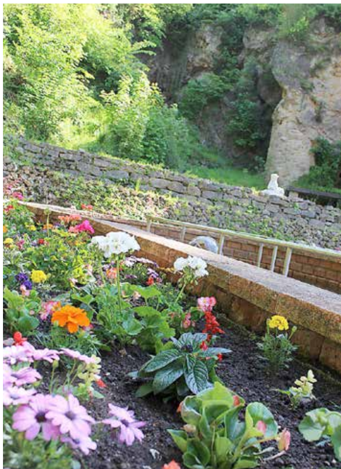
Bad Liebenstein, Kurpark Kneippbecken