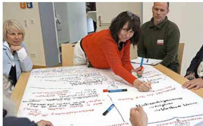
Im Worldcafé fand ein intensiver Austausch statt