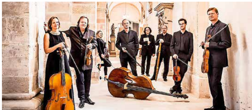
Thüringer Bach Collegium

EISENACH. Unter dem Titel „Der 5. Evangelist - Bach und die Bibel“ veranstaltet die evangelisch-lutherische Kirchengemeinde Eisenach vom 27. bis 31. Oktober 2021 das 5. Eisenacher Bachfest. Eröffnet wird das Bachfest, dessen Hauptspielort die Taufkirche Johann Sebastian Bachs, die Georgenkirche ist, am 27. Oktober mit einem Konzert des international erfolgreichen Ensembles 1704 unter der Leitung von Vaclav Luks. Sie werden 3 Motetten von Johann Sebastian Bach und Werke von Jan Dismas Zelenka zu Gehör bringen. Das Thüringer Bach-Collegium wird am 29. Oktober zusammen mit dem Träger der Leipziger Bach-Medaille Klaus Mertens