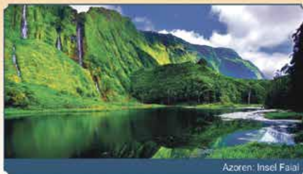
Azoren: Insel Faial