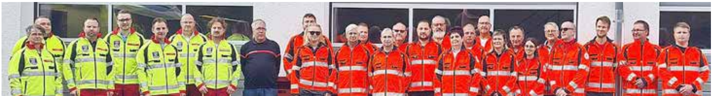
auf dem Bild: der Sanitäts- und Betreuungszug des Wartburgkreises sowie die Organisatorischen Leiter Rettungsdienst.

WARTBURGKREIS. Den Einsatzkräften des Sanitäts- und Betreuungszuges, der Berg-