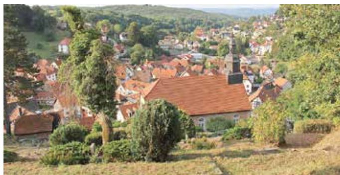
Steinbach, Kirche und Friedhof