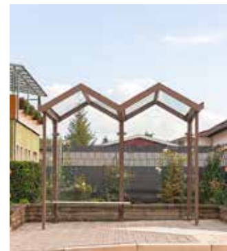
Die von Familie Leimbach bepflanzte Bushaltestelle in Behringen