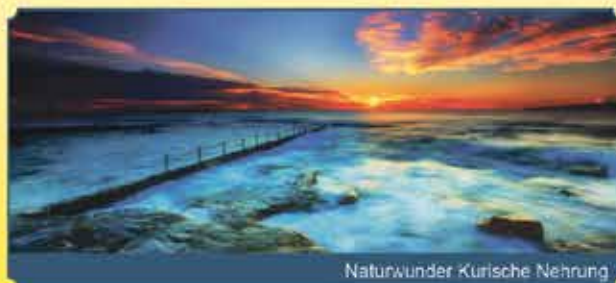
Naturwunder Kurische Nehrung

Bordguthaben: + 50 €! 1 13 Tage ab 1.999 2 €