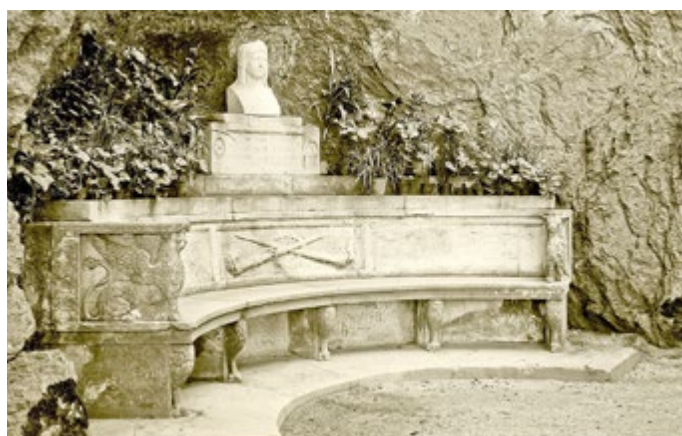
So sah die Greifenbank einstmal aus

Spendenkonto der Stiftung „Bürger für Thüringer Schlösser und Burgen“ IBAN: DE56 8305 0303 0011 0206 01 Kreissparkasse Saalfeld-Rudolstadt BIC: HELADEF 1SAR