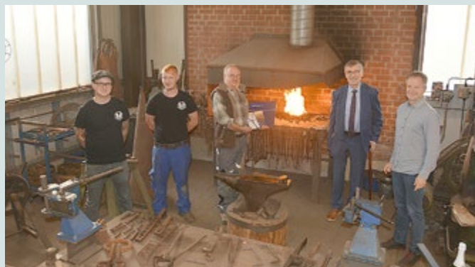
Firmeninhaber und Ehrengäste beim Jubiläum in Merkers

Die Metall- und Stahlbau Meyer GmbH ist Partner für viele Kunden in der Wartburgregion und darüber hinaus und bildet zudem Nachwuchskräfte aus.