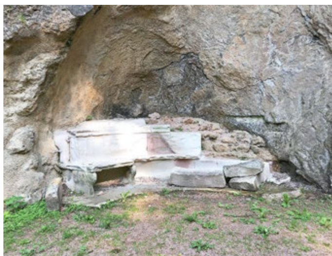
Die Greifenbank im aktuellen Zustand