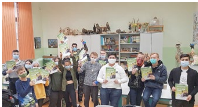
Die Schüler der Eisenacher Goetheschule erhielten das Ausbildungs-Navi

„Ich hoffe, dass das Navi bei der Suche nach einem passenden Ausbildungsplatz in unserer Wartburgregion weiterhilft und freue mich über jeden jungen Menschen, der seine berufliche Zukunft hier bei uns gestaltet“, so der Landrat in seinem Elternbrief.