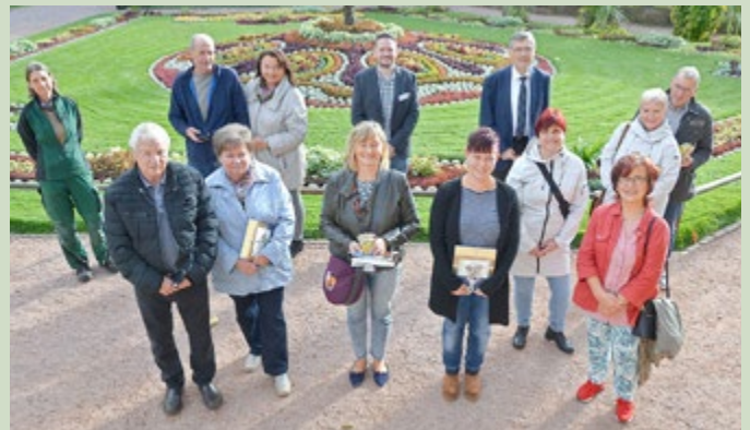
Die Gewinner des Blumenschmuckwettbewerbs 2020