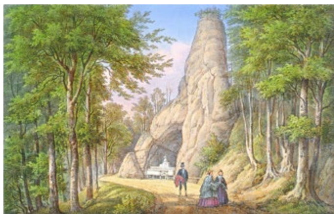
Der Blumenkorbfelsen auf einer historischen Abbildung