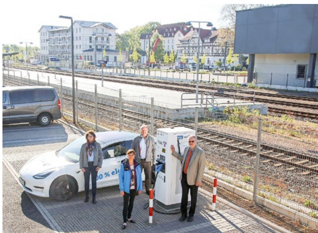
Offizielle Inbetriebnahme der gemeinsam errichteten Schnellladesäule der TEAG und Werraenergie in Bad Salzungen

Zuhause können Sie ihr Auto bequem an einer Wallbox oder einer normalen Haushaltssteckdose ohne Ladekarte laden.