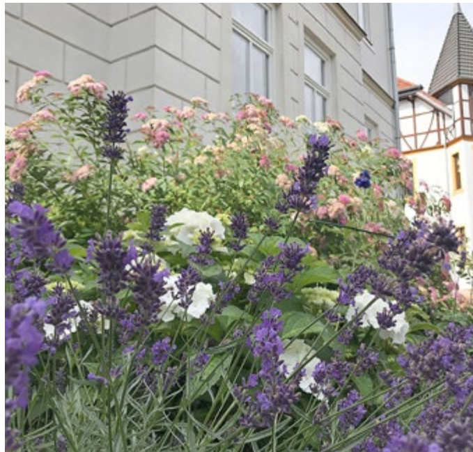
Der prächtige Blumenschmuck von Familie Richling, die im vergangenen Jahr am Wettbewerb teilgenommen hatte